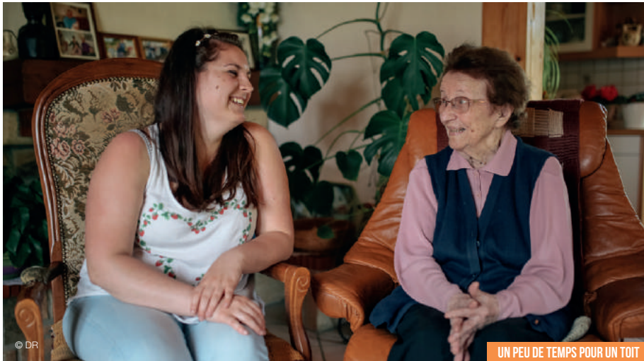
UN PEU DE TEMPS POUR UN TOIT

Contact sur Angers : 06 99 73 14 82 - www.letempspourtoit.fr - info@letempspourtoit.fr