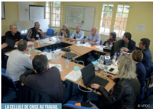
LA CELLULE DE CRISE AU TRAVAIL

// Contact : 06 72 34 63 96 – perrier-gilles@orange.fr , Site Internet: gillesperrierphotographie.com