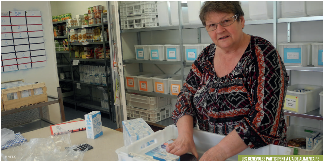
LES BÉNÉVOLES PARTICIPENT À L'AIDE ALIMENTAIRE