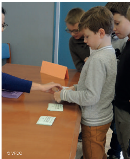
L'ÉDUCATION CITOYENNE EST ENCOURAGÉE PAR LA MAIRIE PAR LE BIAIS DU CONSEIL MUNICIPAL DES ENFANTS