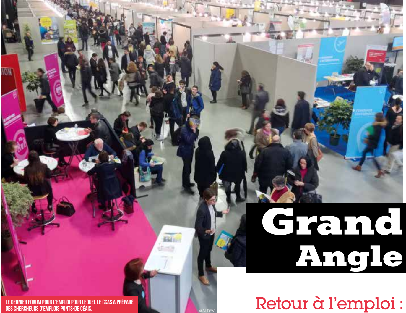
LE DERNIER FORUM POUR L'EMPLOI POUR LEQUEL LE CCAS A PRÉPARÉ DES CHERCHEURS D'EMPLOIS PONTS-DE-CÉAIS.