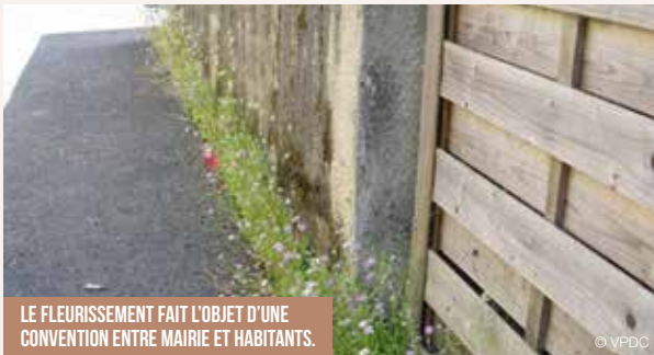
LE FLEURISSEMENT FAIT L'OBJET D'UNE CONVENTION ENTRE MAIRIE ET HABITANTS.

Peut-être avez-vous récupéré, voire déjà planté, vos graines de printemps. Les retardataires devront attendre fin septembre et celles d'automne. Le fleurissement en pied de mur (façades ou limites de propriété) est encouragé depuis le printemps 2016 auprès des Ponts-de-Céais. Imaginé par les élus à la suite du Grenelle de l'environnement, une poignée de jeunes en service civique à Unis-Cité a concrétisé l'opération.