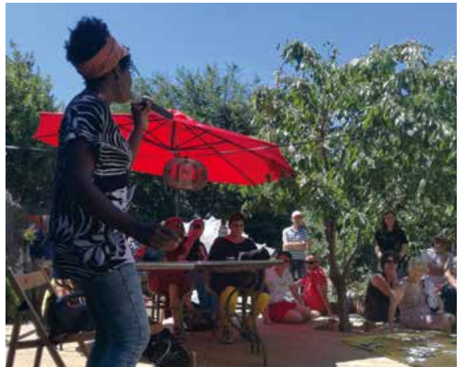
LORS DES PRÉCÉDENTES ÉDITIONS, LE PUBLIC SE PRESSAIT DÈS L'OUVERTURE DES JARDINS.