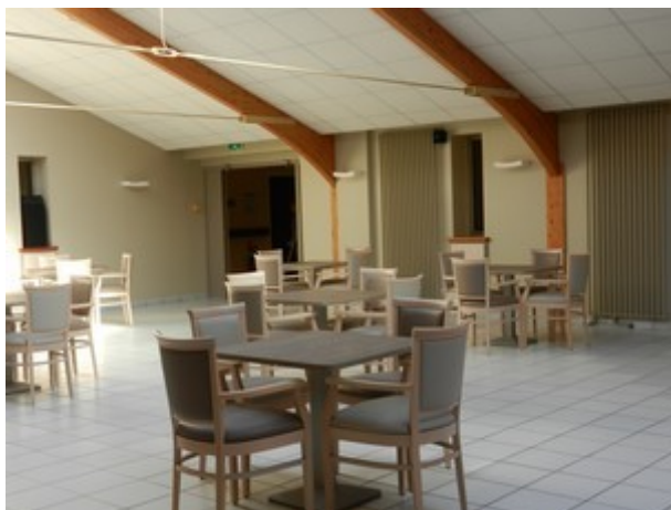
Salle des Goganes (animation)