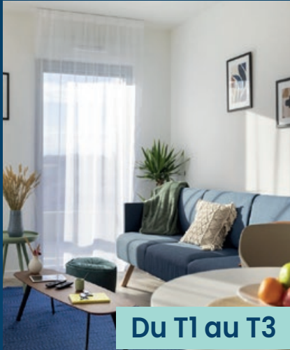
Du T1 au T3