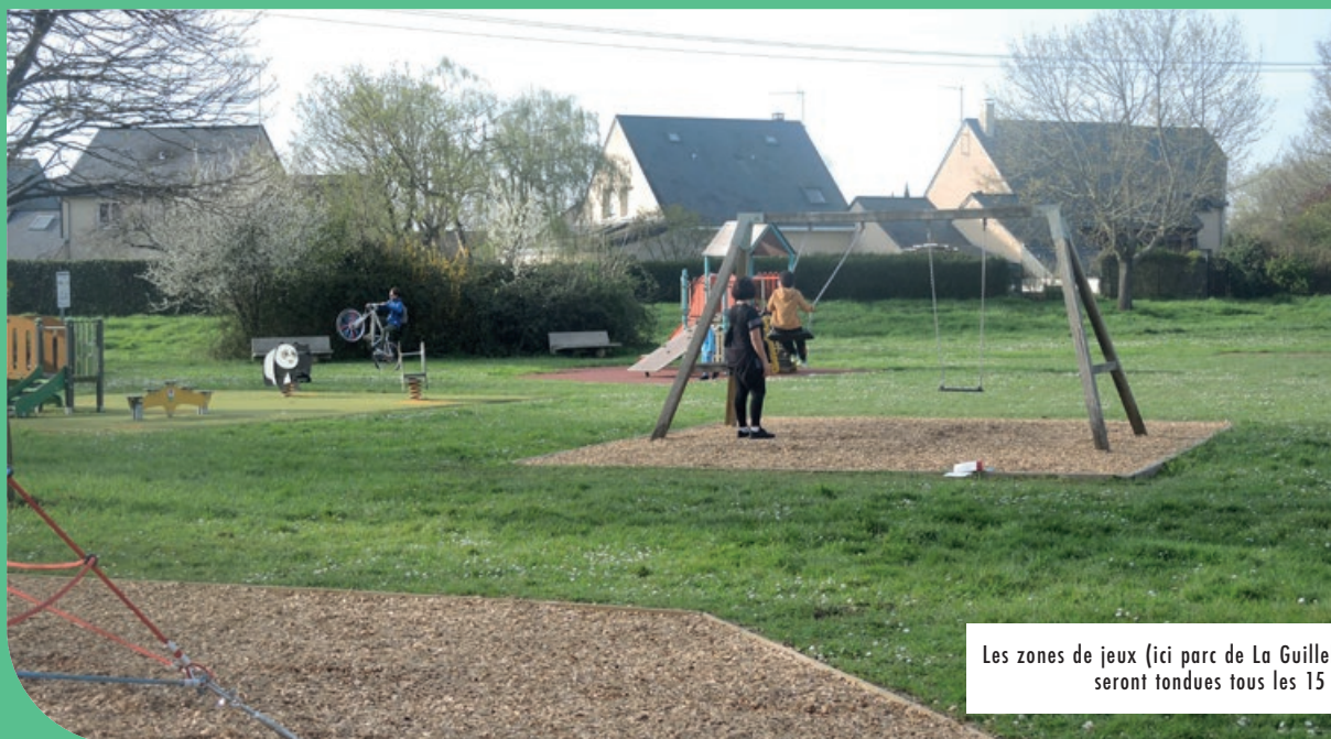
Les zones de jeux (ici parc de La Guillebotte) seront tondues tous les 15 jours.

DANS LE CADRE DE SON ENGAGEMENT EN FAVEUR DU DÉVELOPPEMENT DURABLE, LA VILLE MET EN ŒUVRE UNE GESTION DIFFÉRENCIÉE DE SES ESPACES VERTS. CETTE MÉTHODE D'ENTRETIEN PLUS RESPECTUEUSE DE L'ENVIRONNEMENT CONTRIBUE NOTAMMENT À PRÉSERVER ET FAVORISER LA BIODIVERSITÉ.