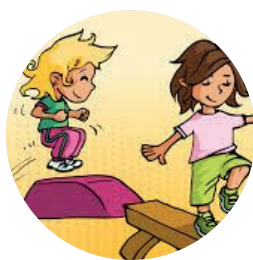
Parcours des aventuriers Mascotte «La marmotte»

À travers les souvenirs de Biscotte, les enfants vont découvrir l'Égypte, l'Asie et, qui sait, des mystères et des trésors enfouis.