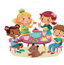
Voitures, Poupées Jeux de société