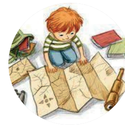
Grand jeu Chasse au trésor